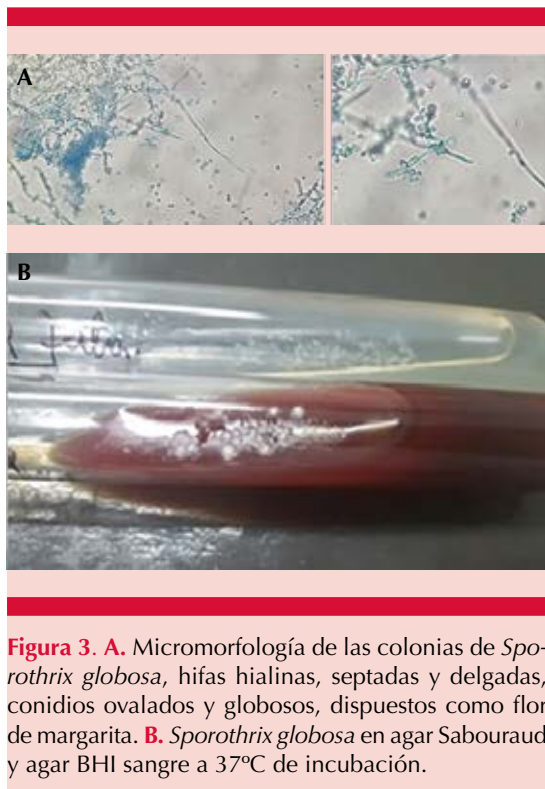
Figura 3. A. Micromorfología de las colonias de Sporothrix globosa , hifas hialinas, septadas y delgadas, conidios ovalados y globosos, dispuestos como flor de margarita. B. Sporothrix globosa en agar Sabouraud y agar BHI sangre a 37°C de incubación.

de este hongo a través del arañazo de gatos u otros animales. 5