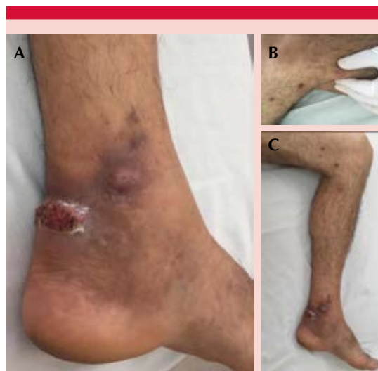
Figura 1. A. Tumoración eritematosa ovalada, de aspecto verrugoso y descamación periférica, tumoración eritematoviolácea de menor tamaño, lesiones que asientan sobre una placa hiperpigmentada localizada en la cara postero-interna del tobillo izquierdo. B. Nódulo eritematovioláceo redondeado, de 2 cm de diámetro, sólido-elástico, en la cara interna de la rodilla izquierda. C. Tumoraciones, nódulos, placas y máculas hiperpigmentadas, que siguen un trayecto lineal del tobillo a la rodilla, en la cara interna de la pierna izquierda.

Con estos datos y la clínica de las lesiones, se realizó biopsia cutánea de la lesión de mayor tamaño, para histopatología y cultivos microbiológicos.