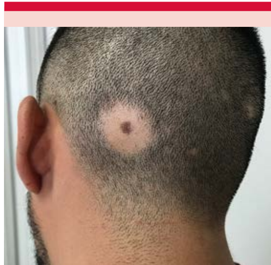
Figura 1. Neoplasia de aspecto macular en la piel cabelluda occipitotemporal rodeada por un halo alopécico.

Paciente masculino de 27 años de edad que acudió a consulta por caída de pelo de forma súbita y asintomática desde hacía tres semanas. A la exploración dermatológica tenía en la piel cabelluda, en el área occipital izquierda, una placa de alopecia que rodeaba una neoformación macular pigmentada color marrón oscuro de límites regulares y bien definidos ( Figura 1 ), de 0.8 x 0.5 cm que a la dermatoscopia demostró una lesión melanocítica con patrón reticular regular de puntos y glóbulos rodeada por escasos pelos en signo de admiración ( Figura 2 ). Previamente sano, el paciente tenía como único antecedente vitíligo en padre y abuelo paterno, además de un hijo de 6 años de edad con vitíligo activo extenso desde hacía dos meses que se había diseminado de forma rápida y no respondía a tratamientos tópicos o sistémicos. Se realizó extirpación y cierre directo en huso, que al estudio histopatológico reveló nidos regulares de melanocitos sin atipias