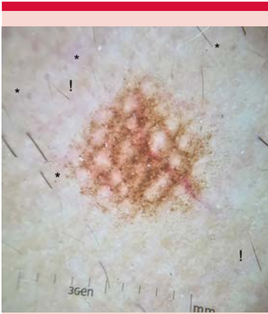
Figura 2. A la tricoscopia con luz polarizada se observa una lesión pigmentada melanocítica con patrón reticular regular de puntos y glóbulos rodeada por escasos pelos vellosos, algunos en signo de admiración (!) y puntos negros (*).

en la unión con denso infiltrado inflamatorio linfocítico alrededor de folículos terminales, pelos en nanógeno en la dermis superficial y estelas foliculares ( Figura 3 ). La tinción de azul alcian no reveló acumulación de mucopolisacáridos. La inmunohistoquímica demostró que el infiltrado perifolicular correspondía a linfocitos T citotóxicos CD8+ y CD4+ que rodeaban las porciones bulbares del segmento inferior del folículo degenerado ( Figura 4 ). Posterior al retiro de suturas, se desarrolló la repoblación pilosa, no fue necesaria la aplicación de esteroides intralesionales.