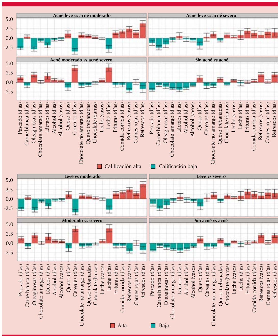
Figura 2. Diferencia en el consumo de cada alimento entre los grupos de calificación de dieta alta y baja. Cada panel representa una de las cuatro comparaciones realizadas. El color de las barras representa cuál grupo tuvo la mayor diferencia. Verde cuando el consumo fue mayor en el grupo de calificación de dieta baja, roja cuando el consumo fue mayor en el grupo de calificación alta. Los intervalos negros representan los intervalos de 95% de confianza. La diferencia es estadísticamente significativa si el intervalo no intercepta el cero.