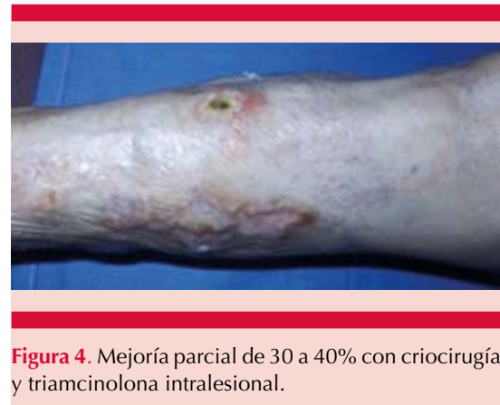
Figura 4. Mejoría parcial de 30 a 40% con criocirugía y triamcinolona intralesional.

La amiloidosis cutánea nodular primaria es la variante menos común de las amiloidosis cutáneas primarias, con menos de 100 casos reportados en la bibliografía hasta 2014. 6 Sus depósitos surgen a partir de la degeneración de cadenas ligeras de inmunoglobulinas a sustancia amiloide AL de