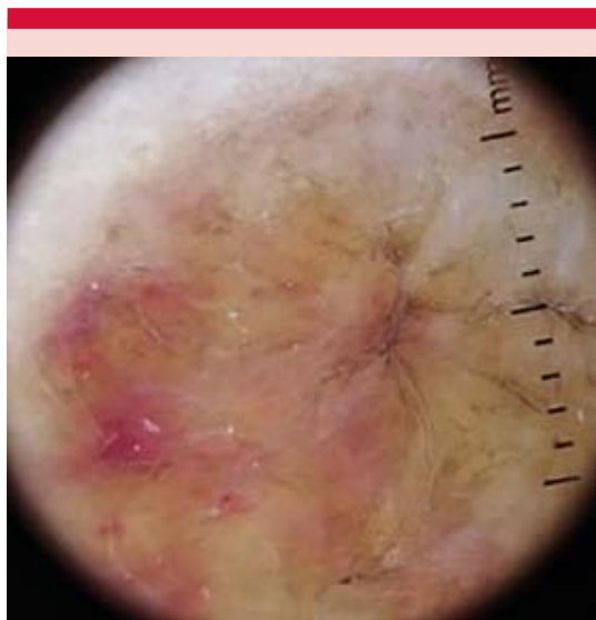
Figura 2. Dermatoscopia, con fondo amarillo homogéneo, en la periferia hay zonas rojo-lechosas, telangiectasias lineales, estrías aracneiformes oscuras.

La biopsia de piel reportó en todo el espesor dérmico depósitos de un material amorfo, acelular ( Figura 3A ) con infiltrado inflamatorio de células plasmáticas de predominio perivascular ( Figura 3B ), que se identificó como amiloide con la tinción de rojo Congo ( Figura 3C y D ).