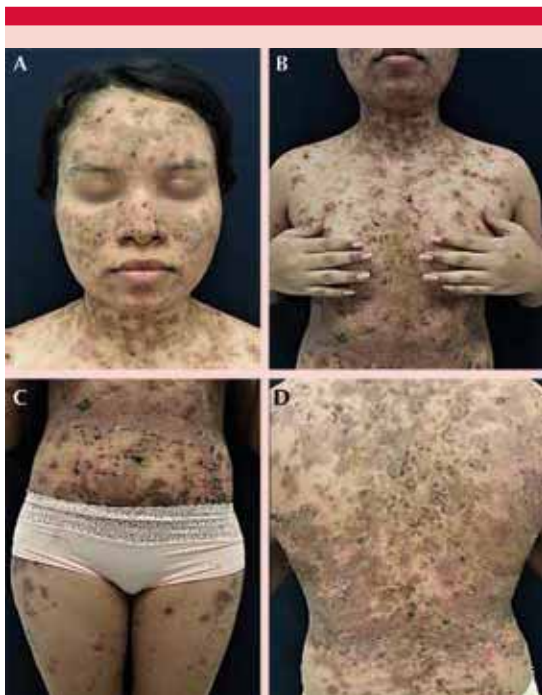
Figura 2. Pénfigo foliáceo subtipo eritematoso. Afectación extensa del cuero cabelludo, rostro, cuello, tronco y abdomen con placas eritematovioláceas erosionadas y escamocostrosas que coalescen con hiperpigmentación residual con poca afectación de las extremidades.

El estudio histológico con hematoxilina y eosina reportó epidermis con ampolla subcórnea, acompañada por numerosas células acantolíticas, cuyo interior se encontraba ocupado por un infiltrado mixto de predominio polimorfonuclear,