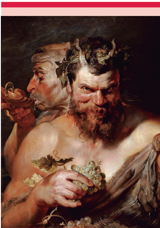
Figura 2. Dos sátiros. Rubens, 1619.

En este sentido, el relato bíblico de Sansón, junto con su representación pictórica, nos invita a reflexionar acerca del pelo no sólo como un atributo