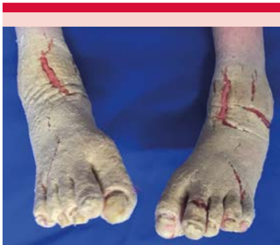
Figura 2. Lesiones hiperqueratósicas y fisuras en los pies, así como onicosis, xantoniquia y onicólisis.