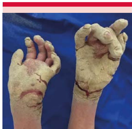
Figura 1. Lesiones en las manos constituidas por pápulas eritematosas y placas hiperqueratósicas con fisuras.

Con los resultados encontrados, se estableció el diagnóstico integral de escabiasis noruega. Se