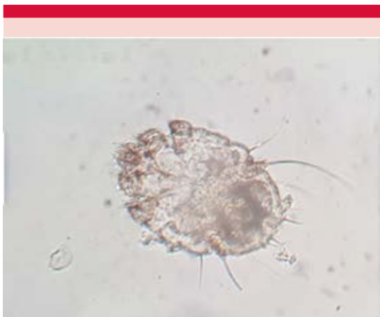
Figura 3. Examen directo con KOH a 20% que demuestra la existencia de ácaro adulto de S. scabiei .

dio tratamiento con ivermectina vía oral a dosis de 200 µg/kg (seis dosis con intervalos de dos semanas), permetrina a 5%, ciprofloxacino y cetirizina, así como medidas de higiene y tratamiento a contactos. Después de cinco meses la paciente mostró alivio de las lesiones cutáneas y de la onicopatía.