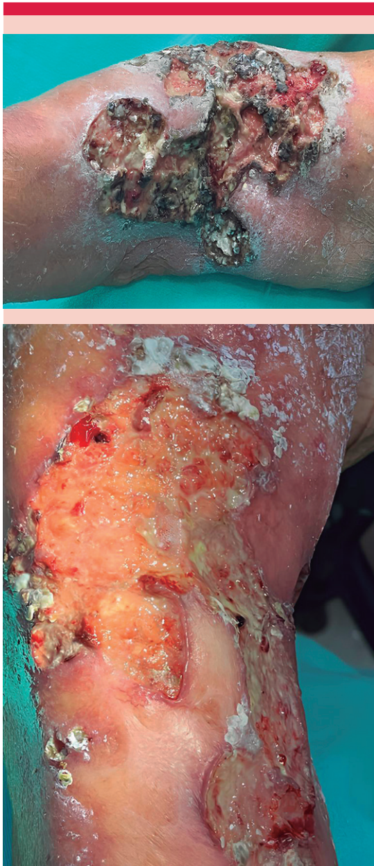
Figura 1. Placa de aspecto verrugoso constituida por eritema, pústulas y ulceración con fondo sucio y salida de material purulento, de bordes irregulares y mal definidos.

eritema, escamas, úlcera central con fondo sucio y salida de material purulento. Figura 1