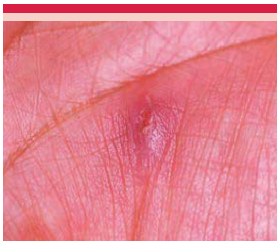
Figura 3. Nódulo ulcerado en la palma de la mano derecha.

Paciente femenina de 35 años de edad, investigadora de la UNAM, que accidentalmente se rompió un frasco con cepas de S. schenckii , lo que causó una herida cortante en la mano derecha; tres semanas después la paciente inició con un nódulo en el centro de la palma de la mano que se ulceró (Figura 3). Se tomó cultivo de la secreción en medio gelosa Agar de Sabouraud, se desarrolló una colonia membranosa con áreas de pigmentación negra y se identificó S. schenckii (Figura 4). Se prescribió yoduro de potasio, que no toleró la paciente, y posteriormente terbinafina, 250 mg diarios durante dos meses, con buena respuesta.