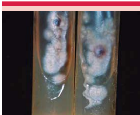
Figura 4. Cultivo agar gelosa de Sabouraud, colonia de S. schenckii membranosa con algunas áreas negras.