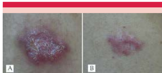
Figura 1. A. Nódulo en el muslo. B. Aspecto después del tratamiento.

de diámetro con una úlcera superficial en el centro, sin secreción y asintomática (Figura 1A). La paciente negó el antecedente de algún traumatismo cutáneo o un manejo inadecuado de los medios de cultivo. Se tomó muestra de la lesión y se realizó cultivo en gelosa de Sabouraud, en el que se desarrolló S. schenckii . En el estudio histopatológico se observó hiperplasia epidérmica e infiltrado inflamatorio agudo crónico, con la existencia de un cuerpo asteroide en el centro de una acumulación de neutrófilos (Figura 2). Se decidió seguir una conducta observacional debido al embarazo; la lesión se mantuvo estable, sin progresión. Al término del embarazo y posterior a tres meses