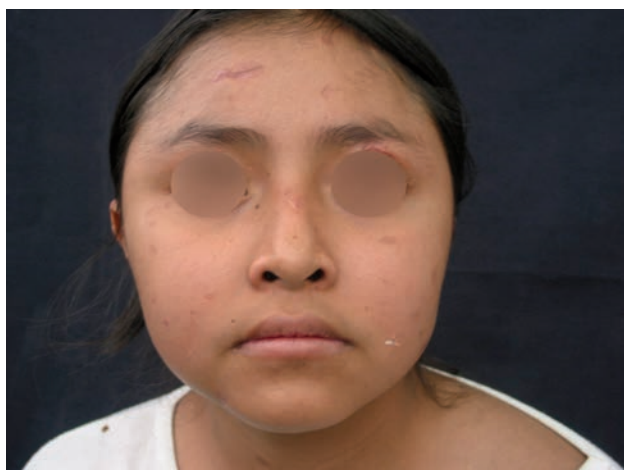
Figura 2. Un mes después del tratamiento con prednisona y talidomida.

después la paciente tuvo disfonía, estridor laríngeo, fiebre y dificultad respiratoria progresivos. Desde el punto de vista clínico, nuevamente tuvo pápulas y nódulos diseminados; se tomó una nueva biopsia de piel, que fue negativa para proceso neoplásico; sin embargo, una biopsia de mucosa nasal y laríngea hecha por el departamento de Otorrinolaringología diagnosticó linfoma nasal T/NK (CD56+).