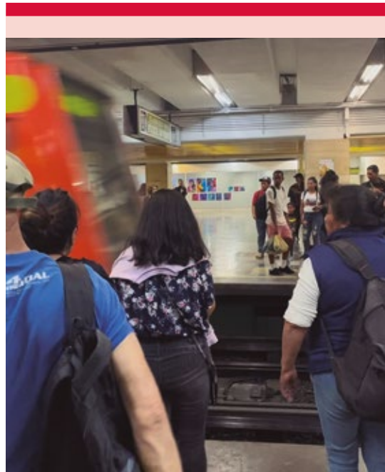
Figura 1. Vista de la exposición saliendo de los vagones del metro.

In the world of art, we have seen how visual representations have transformed the perception of beauty throughout history. A notable example comes from the muralist movement in the 20th century; artists such as Diego Rivera, Jose Clemente Orozco, David Alfaro Siqueiros, and Frida Kahlo used their works to represent people, like you and me, on a monumental scale. In doing so, they challenged traditional beauty norms and highlighted the dignity of diversity.