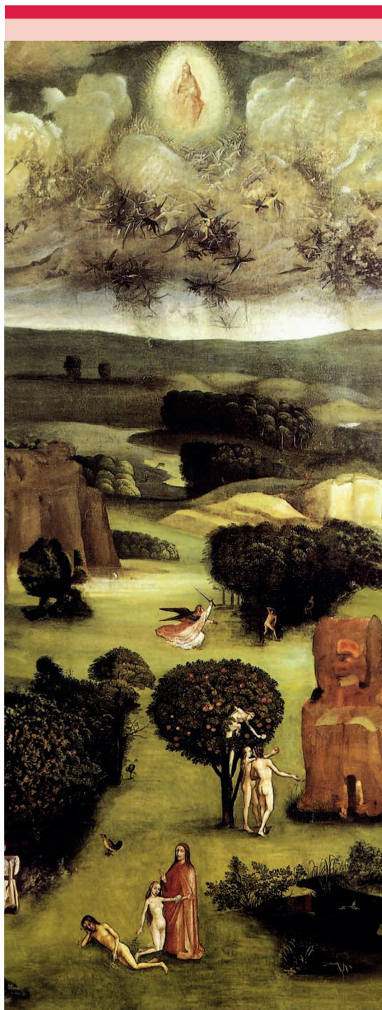
Figura 3. Acercamiento del panel izquierdo del tríptico de El Juicio Final .