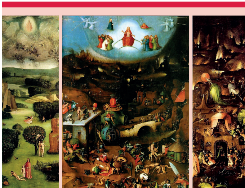
Figura 1. El tríptico de El Juicio Final es un cuadro del pintor flamenco El Bosco.