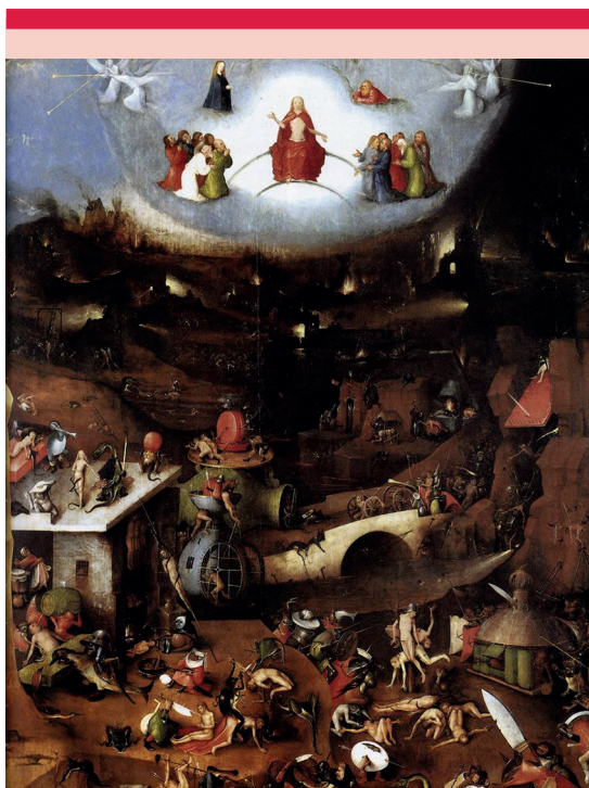
Figura 2. Panel central del tríptico de El Juicio Final .

El cuadro se compone de tres paneles, los cuales conforman un tríptico. En el panel central del retrato se representan los siete pecados capitales ( Figura 2 ). Por su parte, en el ala izquierda ( Figura 3 ) se observa la caída del hombre, la creación de Eva y Adán, los animales que viven con los humanos sin interacción ni expulsión; representando así el pecado original. En la parte superior del panel central, en un área brillante se encuentra Dios y en el panel de la derecha