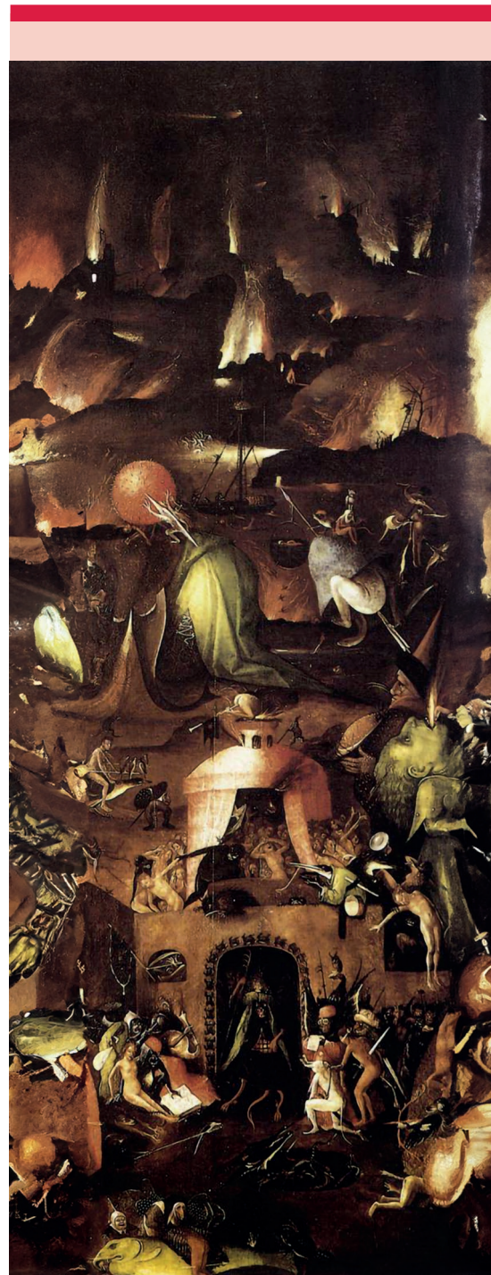
Figura 4. Acercamiento del panel derecho del tríptico de El Juicio Final .

Claviceps purpurea es un hongo ascosporado que parasita las gramíneas: el centeno y de forma menos frecuente la avena, el trigo y la cebada, de ahí su nombre de cornezuelo de centeno, de manera que cuando pasa inadvertido en la molienda provoca severas intoxicaciones a humanos y animales, ya que contiene alcaloides muy potentes similares al ácido lisérgico (LSD). Este hongo tiene dos fases: una que se encuentra en la tierra en forma de hongo microscópico,