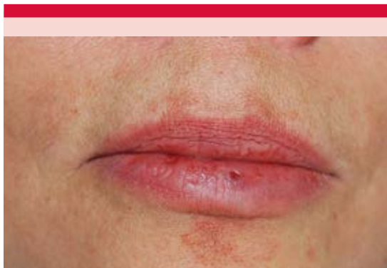
Figura 1. Úlcera circular de 3 mm, bien delimitada, de fondo limpio y cubierta por una costra hemática en el borde bermellón inferior.

a expensas de los procesos interpapilares y una úlcera en el centro de la lesión cubierta de fibrina y costra serohemática. En el corion superficial y medio se observó extravasación de eritrocitos, con numerosos vasos sanguíneos de diferentes tamaños y grosor de sus paredes, unos pequeños y delgados y otros con paredes muy gruesas, que parecían tener una disposición en espiral ascendente. En el área superior los vasos se mostraron irregulares con formación de algunas papilas que protruían hacia la luz vascular y estaban en contacto con la úlcera ( Figura 2 ). Las tinciones de inmunohistoquímica para CD31 resaltaron las células endoteliales. Figura 3